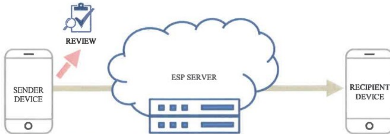
Figure 4: all detection done on-device

Device: applies tools to detect CSA (e.g. hashing of images and matching with a database of known CSAM). If CSA is: a) not detected \Rightarrow encrypts message end-to-end and sends to recipient b) detected \Rightarrow sends message for review and/or reporting